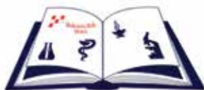
Medicinska škola Šibenik